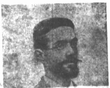
Mateo Morral, que tentou justicar o degenerado representante da tyrannia hespanhola